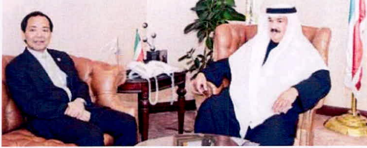
المضف مستقبلاً السفير الياباني

السحب والإضافة الى يوم السبت المقبل لإتاحة الفرصة لهم، مؤكداً أن المضف وعد بتوفير جميع متطلبات الاتحاد.